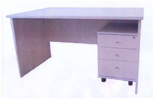
Катедра за предаваче